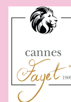
FAYET CANNE DE MARCHÉ POINTE EN CORNE BLONDE SUR BÂTON EN ÉBÈNE