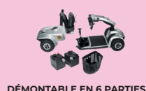
DÉMONTABLE EN 6 PARTIES