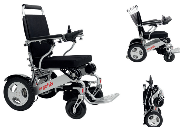
ERGOFLIX FAUTEUIL ROULANT ELECTRIQUE L-BACK