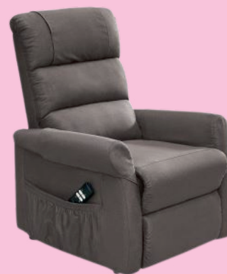
FAUTEUIL RELEVEUR TIVOLI LSE

MÉDICAL LAFAYETTE CLÉON D'ANDRAN - 26450 - 2 BIS RUE DES ARTISANS 04 28 99 24 64