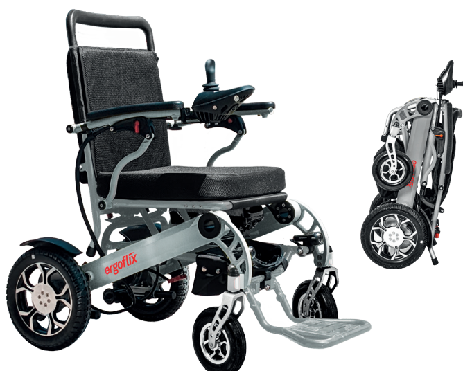
ERGOFLIX FAUTEUIL ROULANT ELECTRIQUE FLIXONE