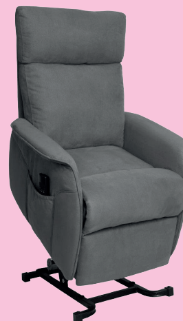
FAUTEUIL RELEVEUR MONZA LSE